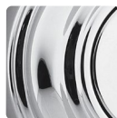
Chrome Luisant 26