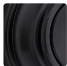
Noir Mat 514