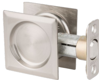
Serrure de porte de passage contemporaine en Nickel Satin