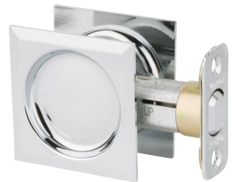
Serrure de porte de passage contemporaine en Chrome Luisant